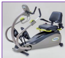
ニューステップで全身運動